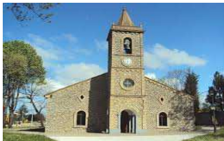
Parroquia de S. Julián Rocés